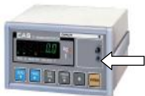
Рис. 2. Индикатор CI-6000A