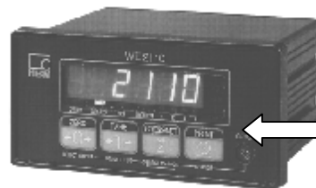
Рис. 3. Индикатор WE2110