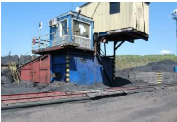
Рис. 1. Весы вагонные для статического взвешивания «ТР-ЖД-СТ»

Внешний вид весов вагонных для статического взвешивания «ТР-ЖД-СТ» представлен на рисунке 1.