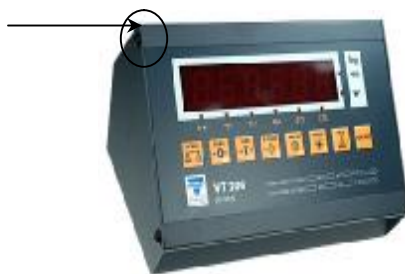
Рис. 4. Индикатор VT 200

Идентификационные данные ПО представлены в таблице 1