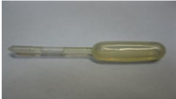
Рисунок 1 – Внешний вид источников микропотока ИМ-ВРЗ исполнение ИМ-ВРЗ-24-М-И

ИМ относятся к невосстанавливаемым, неремонтируемым, однофункциональным изделиям.