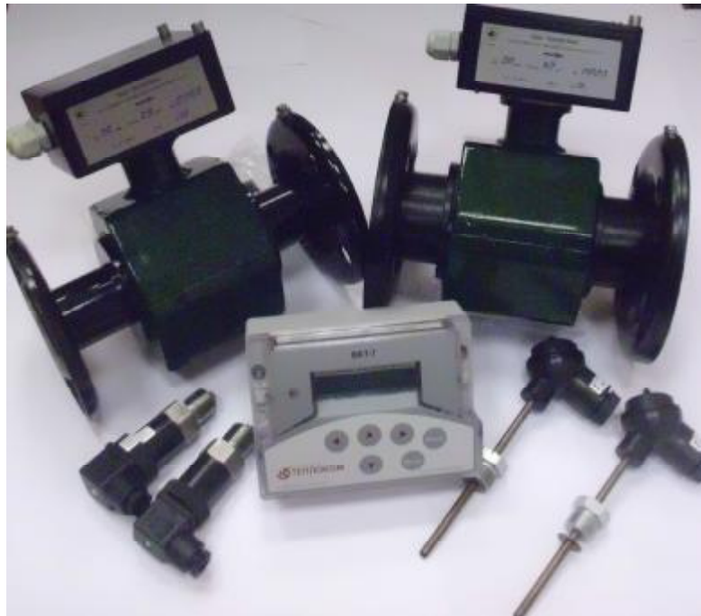
Рисунок 1 – Внешний вид теплосчетчика