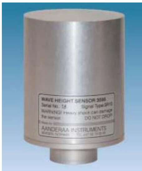
Рис. 1 Внешний вид измерителей 3595

Измерители 3595 работают круглосуточно, имеют на выходе цифровой сигнал формата AADI SR10.