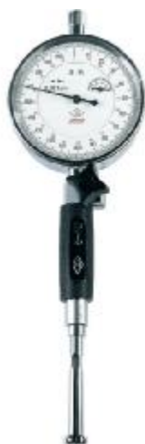
Рисунок 1 – Нутромер индикаторный серий 808 и 810

Измерение нутромером происходит двухточечным контактом с измеряемой поверхностью относительным методом. Отсчетное устройство – индикатор часового типа с ценой деления 0,01 мм (серии 808 и 809) или 0,001 мм (серии 810 и 811). Для совмещения линии измерений с осевой плоскостью измеряемого отверстия нутромеры снабжены центрирующим мостиком (серии 809 и 811). Измерение требуемого размера обеспечивается с помощью одного из входящих в комплект сменных стержней (серии 809 и 811). Нутромеры серий 808 и 810 имеют раздвижные измерительные наконечники, которые раздвигаются за счет цангового механизма. Настройка производится по аттестованным установочным кольцам или блокам концевых мер длины с боковиками.