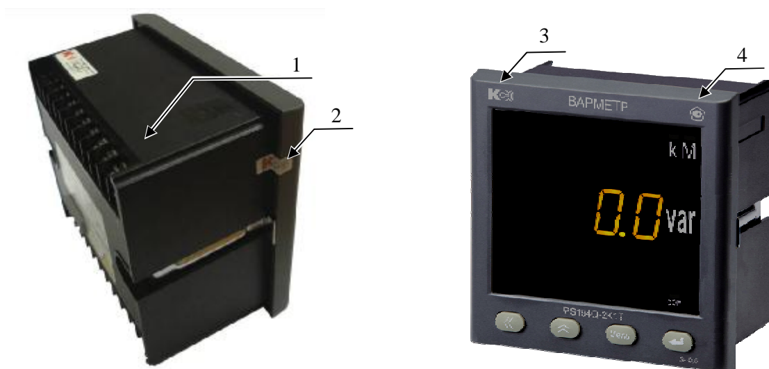
Рисунок 3 – Фотографии общего вида приборов цифровых электроизмерительных