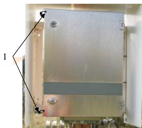
Рисунок 2. Схема пломбирования станций «Snow». 1 – пломбы на модуле преобразователей измерительных.