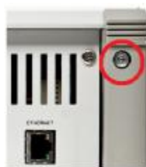
Рисунок 3 – Место на задней панели для пломбирования от несанкционированного доступа