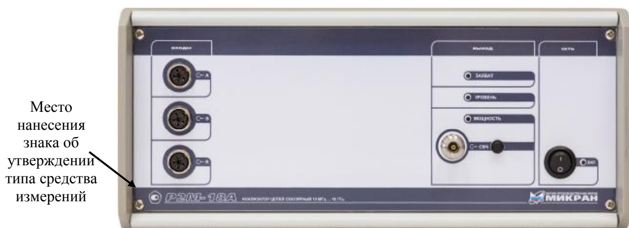
Рисунок 2 – Внешний вид анализаторов цепей скалярных P2M-18A/1, P2M-18A/2, P2M-18A/5, P2M-18A/6