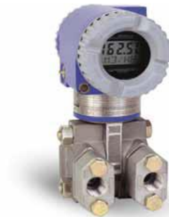
Рисунок 18 – Общий вид преобразователей модели IPD10 (исполнения А, В, С, D, Е)