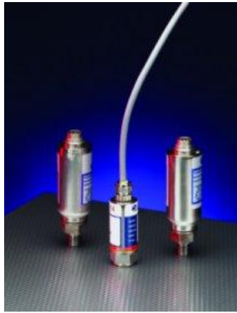
Рисунок 19 – Общий вид преобразователей моделей IDX283, IDX383, IDX284, IDX384