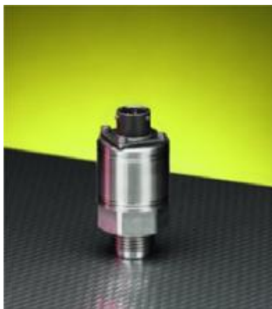
Рисунок 29 – Общий вид преобразователей модели PT311