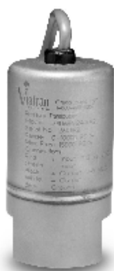
Рисунок 3 – Общий вид преобразователей моделей 140, 240, 340