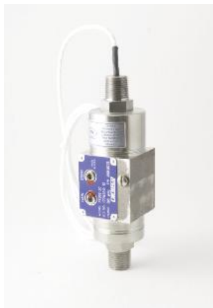
Рисунок 23 – Общий вид преобразователей модели PT303