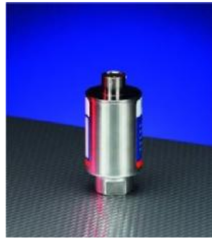
Рисунок 20 – Общий вид преобразователей моделей PT130, PT140, PT150, PT160