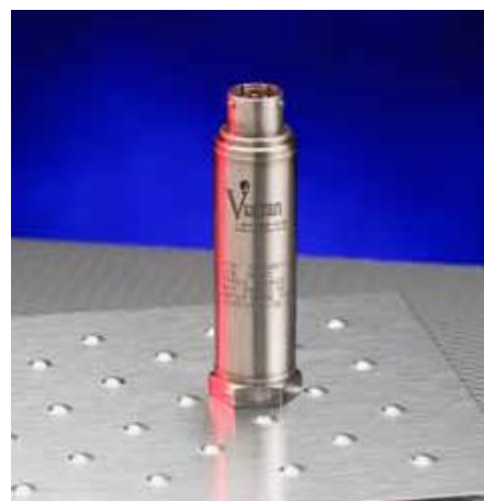
Рисунок 2 – Общий вид преобразователей моделей 122, 222, 322