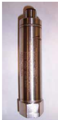
Рисунок 17 – Общий вид преобразователей модели CN422