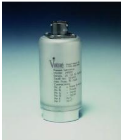
Рисунок 9 – Общий вид преобразователей моделей 246, 346