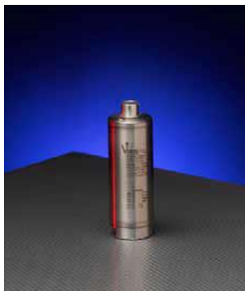
Рисунок 11 – Общий вид преобразователей моделей 249, 349