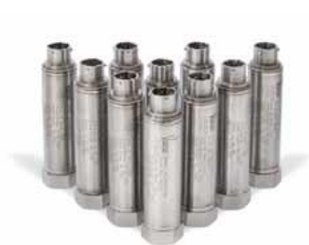
Рисунок 16 – Общий вид преобразователей модели 422