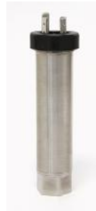
Рисунок 14 – Общий вид преобразователей моделей 281, 381, 282, 382