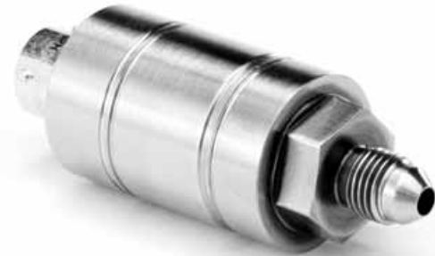
Рисунок 26 – Общий вид преобразователей модели PT338