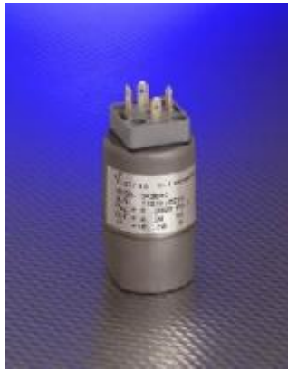
Рисунок 7 – Общий вид преобразователей моделей 243, 343