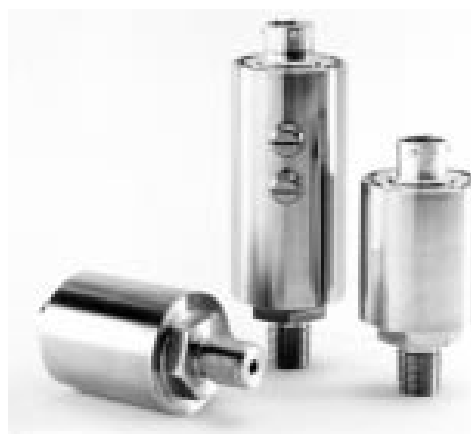
Рисунок 32 – Общий вид преобразователей моделей PT273, PT274, PT275A, PT276A