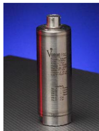
Рисунок 6 – Общий вид преобразователей модели 359