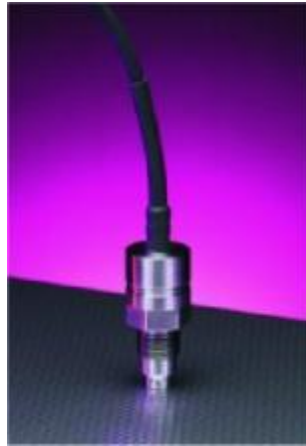
Рисунок 27 – Общий вид преобразователей модели PT375