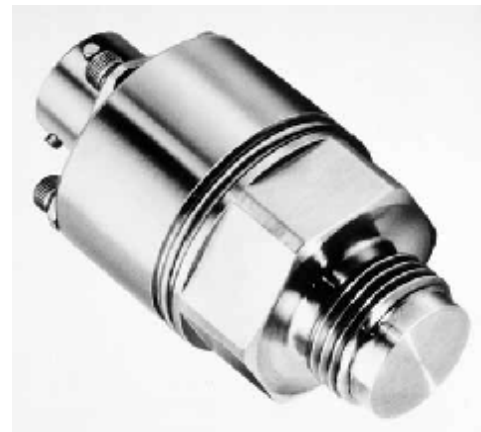
Рисунок 24 – Общий вид преобразователей модели PT311JA