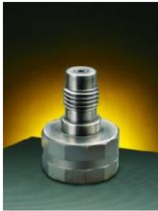
Рисунок 25 – Общий вид преобразователей моделей PT332, PT332C