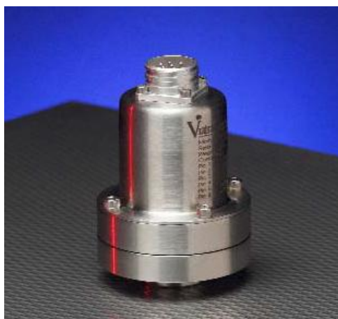
Рисунок 1 – Общий вид преобразователей моделей 104, 118, 218, 318