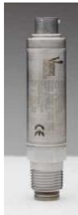
Рисунок 15 – Общий вид преобразователей модели 385