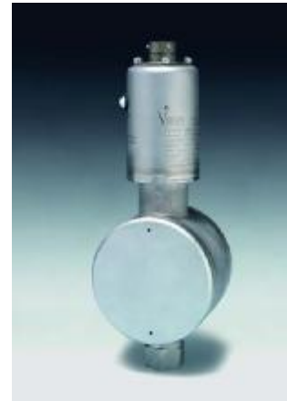
Рисунок 8 – Общий вид преобразователей моделей 244, 344