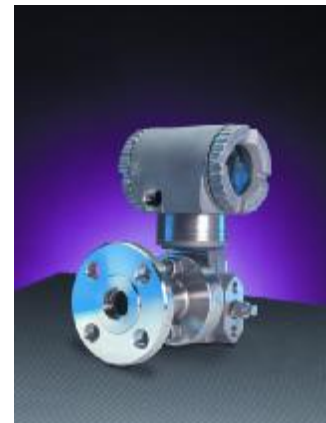
Рисунок 28 – Общий вид преобразователей модели IDG10