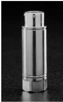
Рисунок 21 – Общий вид преобразователей моделей PT139, PT139A