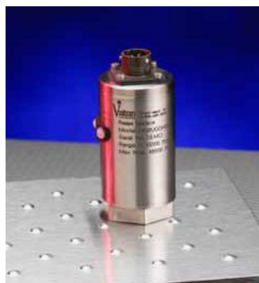
Рисунок 5 – Общий вид преобразователей моделей 202, 302, 245, 345, 245DC, 345DC