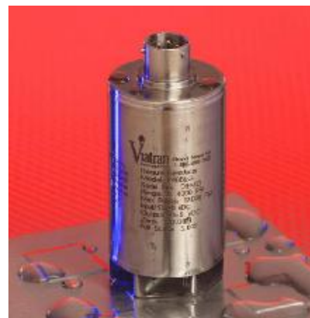
Рисунок 4 – Общий вид преобразователей моделей 148, 248, 348, 201, 301