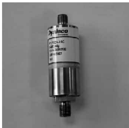
Рисунок 31 – Общий вид преобразователей модели PT270DN