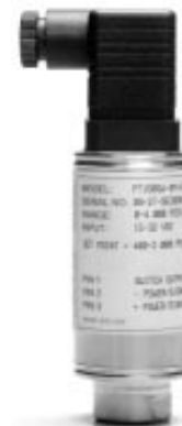
Рисунок 30 – Общий вид преобразователей модели PT160SW