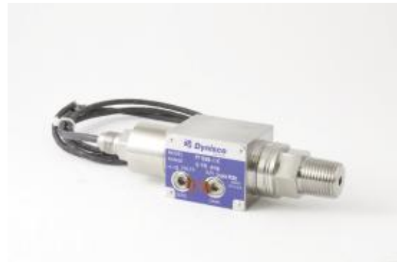
Рисунок 22 – Общий вид преобразователей модели PT199