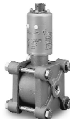
Рисунок 12 – Общий вид преобразователей моделей 274, 374