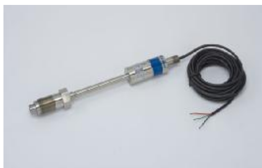
Рисунок 7 – Общий вид преобразователей моделей SPX-L (5341 - 5392), SPX-T (3241 - 3392)