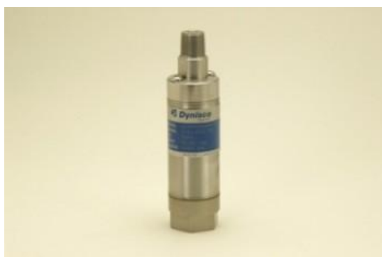
Рисунок 5 – Общий вид преобразователей модели SPX (2000 - 2999)