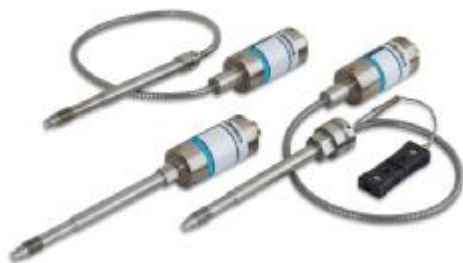
Рисунок 1 – Общий вид преобразователей моделей MDA410, MDA412

Общий вид преобразователей показан на рисунках 1-7.