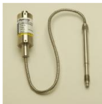
Рисунок 6 – Общий вид преобразователей модели SPX (4000 - 4999)