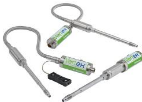
Рисунок 4 – Общий вид преобразователей модели VERTEX