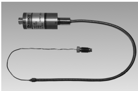
Рисунок 3 – Общий вид преобразователей моделей MDT435F, MDT435X, MDT460, MDT460 F, MDT460 X, MDT463F, MDT463X, DT467F, MDT467X, MDT432F, MDT432X, MDA422, MDA432, MDA435, MDA462, MDA463, MDA467, MDT420