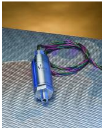
Рисунок 5 – Общий вид преобразователей моделей 548, 748, 848