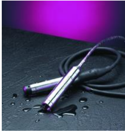
Рисунок 3 – Общий вид преобразователей модели 517