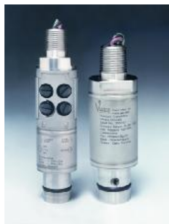
Рисунок 7 – Общий вид преобразователей моделей 553, 554