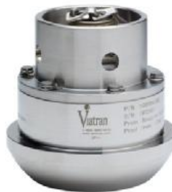
Рисунок 2 – Общий вид преобразователей модели 520