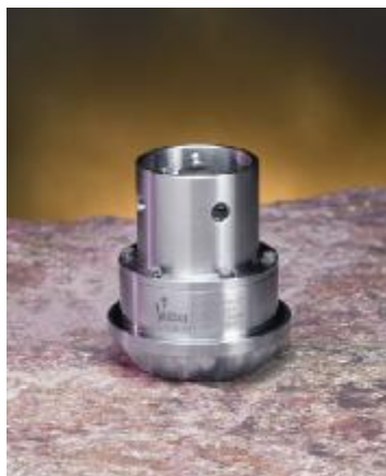
Рисунок 1 – Общий вид преобразователей моделей 509, 709, 809

Общий вид преобразователей показан на рисунках 1-17.