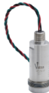
Рисунок 6 – Общий вид преобразователей моделей 550, 551