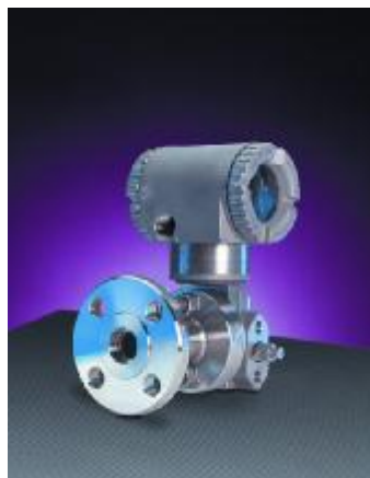
Рисунок 15 – Общий вид преобразователей модели IGP10 (исполнения C, D, E, F)