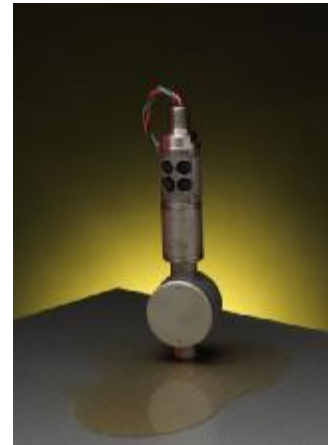
Рисунок 4 – Общий вид преобразователей модели 544