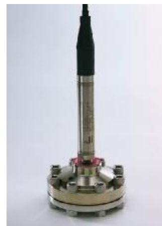
Рисунок 16 – Общий вид преобразователей модели WW517