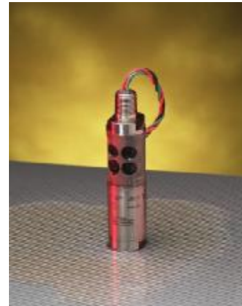
Рисунок 10 – Общий вид преобразователей модели 571