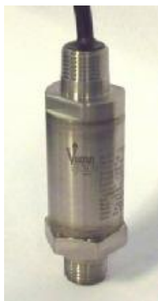
Рисунок 13 – Общий вид преобразователей модели 780