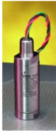
Рисунок 9 – Общий вид преобразователей моделей 570, 770, 870