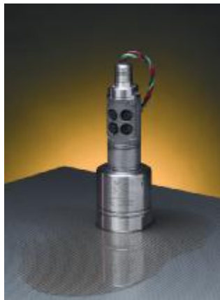
Рисунок 11 – Общий вид преобразователей модели 572