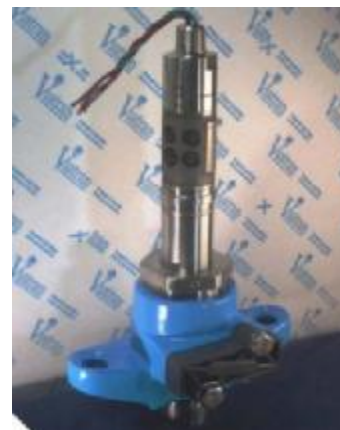
Рисунок 8 – Общий вид преобразователей модели 555