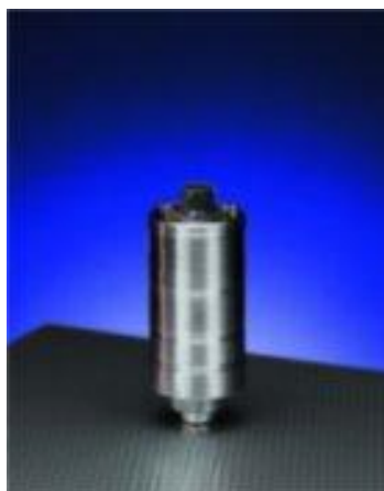
Рисунок 17 – Общий вид преобразователей моделей 8X0, 8X1, 8X2