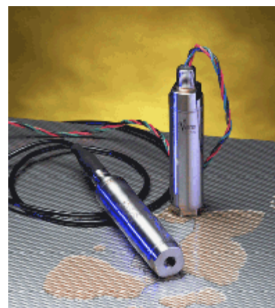
Рисунок 14 – Общий вид преобразователей модели 970