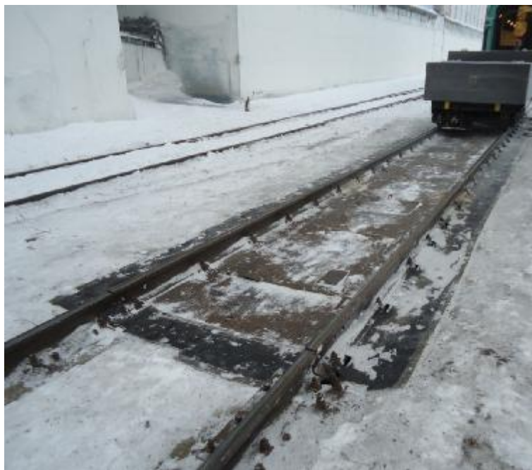
Рисунок 1 – Внешний вид грузоприемного устройства

Внешний вид грузоприемного устройства представлен на рисунке 1, весоизмерительного прибора – на рисунке 2.