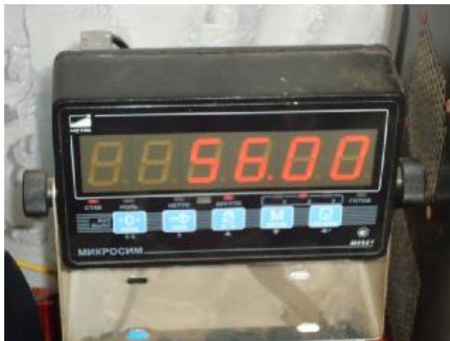
Рисунок 2 – Внешний вид прибора весоизмерительного Микросим-06

Принцип действия весов основан на преобразовании силы тяжести взвешиваемого груза посредством датчиков весоизмерительных тензорезисторных С в электрический сигнал, который обрабатывается в приборе весоизмерительном Микросим-06. Весоизмерительный прибор индицирует массу груза.