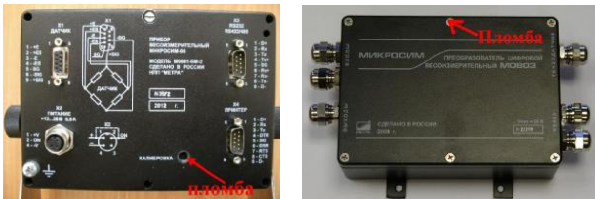
Рисунок 2 Общий вид Микросим 06 и Микросим 0803