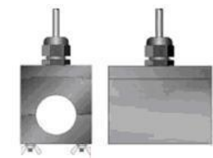
а) DTTS, DTTC

Фотографии внешнего вида расходомеров и места нанесения поверительных клейм (наклеек и пломб)