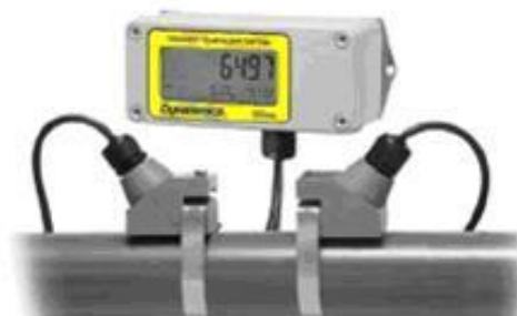
б) разнесенное исполнение