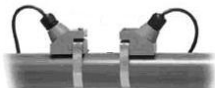
в) DTTN, DTTH, DTTL