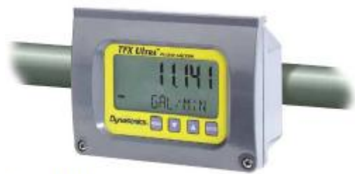
а) компактное исполнение