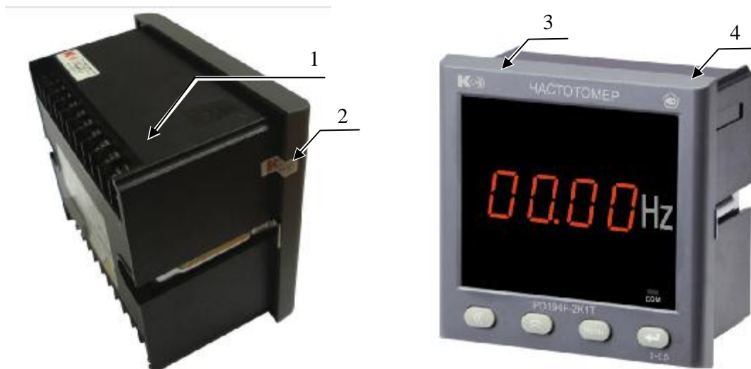
Рисунок 2 – Фотографии общего вида частотомеров PD194F