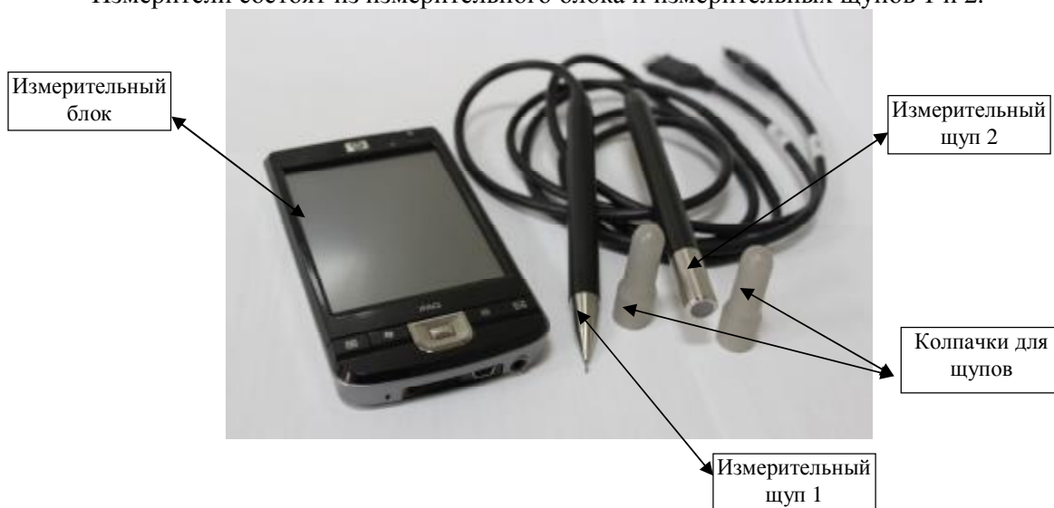
Рисунок 1 - Общий вид измерителей яркости и цвета источников света «ФОТОН – ЯЦ2»

Измерители состоят из измерительного блока и измерительных щупов 1 и 2.