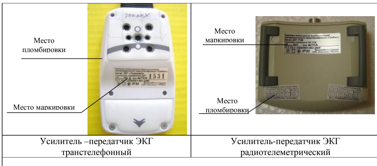
Схема маркировки и пломбировки представлена на Рисунке 2.