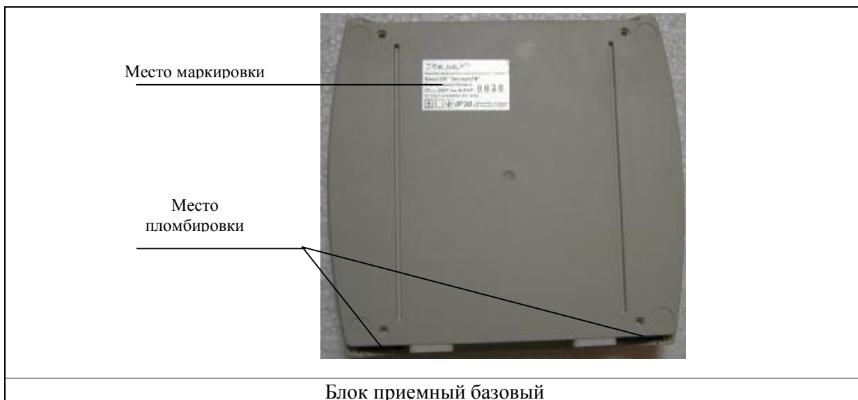
Рисунок 2 – Схема маркировки и пломбировки компонентов комплекса медицинского диагностического телеметрического транстефонного «Тредекс»