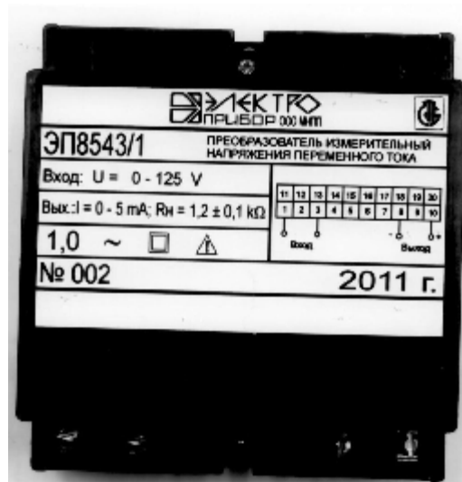
Рисунок 1 - Внешний вид преобразователя измерительного напряжения переменного тока ЭП8543.

Схема пломбировки от несанкционированного доступа и указание мест для нанесения оттиска клейма ОТК и оттиска клейма знака поверки средств измерений на ИП приведены на рисунке 2.