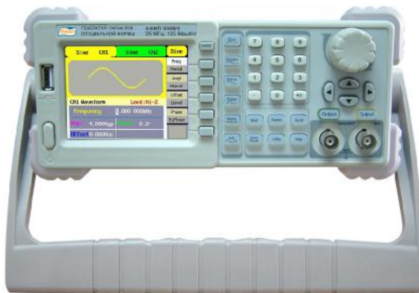
Рисунок 1 – Общий вид генератора

Генераторы представляют собой лабораторные многофункциональные измерительные приборы, принцип действия которых основан на технологии прямого цифрового синтеза, который позволяет получать стабильные, высокоточные сигналы с низким коэффициентом нелинейных искажений практически любой формы. На передней панели генератора находится цветной жидкокристаллический дисплей, состоящий из двух частей: в верхнем окне отображается форма генерируемого сигнала, в нижнем окне – его параметры. Справа от дисплея находится вертикальный ряд кнопок меню, с помощью которых пользователь может ввести меню различных генерируемых функций, и ряд кнопок, используемых при генерации стандартных форм сигналов. В нижней части панели расположены выходные разъемы двух каналов и кнопки, используемые при выборе функций модуляции. Для ввода цифровых параметров на панели имеется три группы органов управления: кнопки направлений (со стрелками), вращающийся регулятор параметров и цифровая клавиатура.