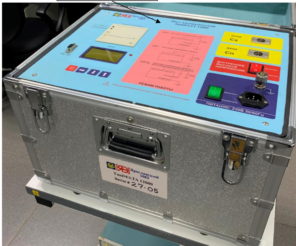
Рисунок 1 – Общий вид мостов автоматических TanDelta 12000