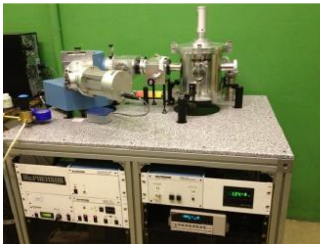
Рисунок 1 - Общий вид спектрорадиометра вакуумного ультрафиолетового VUVaS 1000

Конструкция спектрорадиометра включает дейтериевый источник УФ-излучения, фокусирующее зеркало, комплект светофильтров, монохроматор, коллиматор, поляризатор, а также персональный компьютер с платой PCI-GPIB и интерфейсный кабель PCI-GPIB.