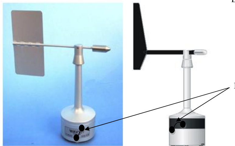
Рисунок 2. Схема пломбирования преобразователей WAV151/252. Пломбы– 1.