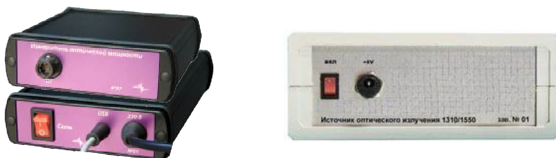
Рисунок 2 - Схема маркировки измерителя мощности и источника оптического излучения РЭСМ-В (вид сзади)