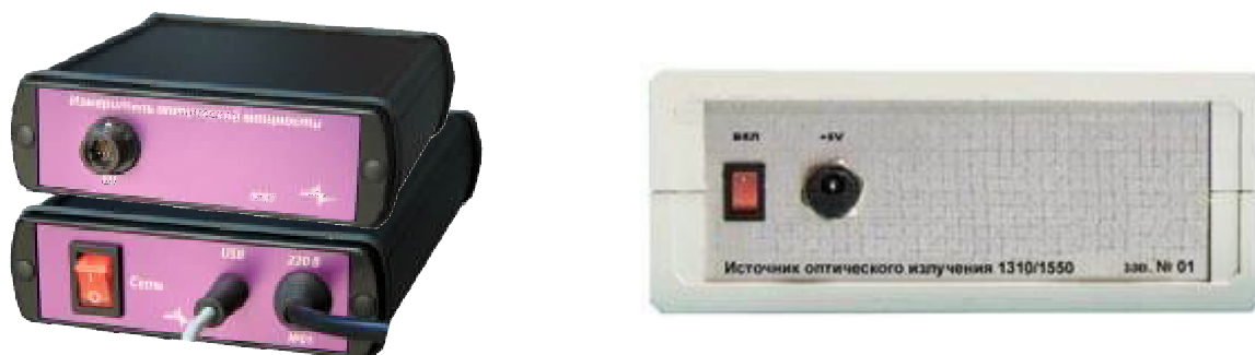
Рисунок 2 - Схема маркировки измерителя мощности и источника оптического излучения аппаратуры (вид сзади)