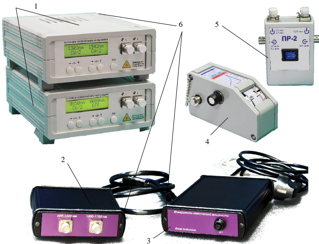
Рисунок 1 - Общий вид и места пломбирования аппаратуры