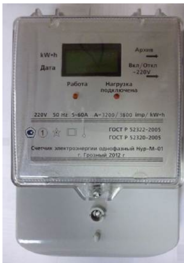
Рисунок 1- Общий вид

Нур-М-03(1,0/Э/И1/БИ/Р1/Т0)- счетчик первого класса точности с электронным индикатором, идентификатором типа iButton, без интерфейса RS-485.