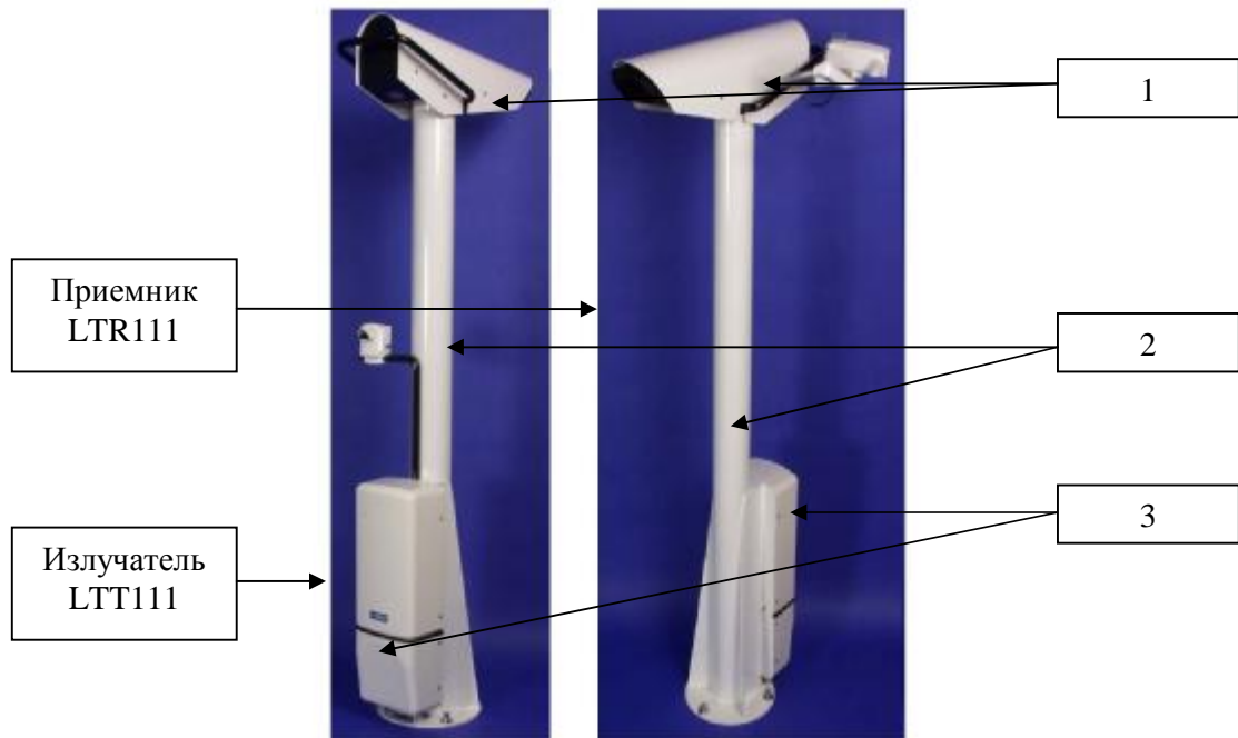
Рисунок 1. Трансиссометры LT31 1 - Измерительный блок, 2-мачта, 3-интерфейсный блок