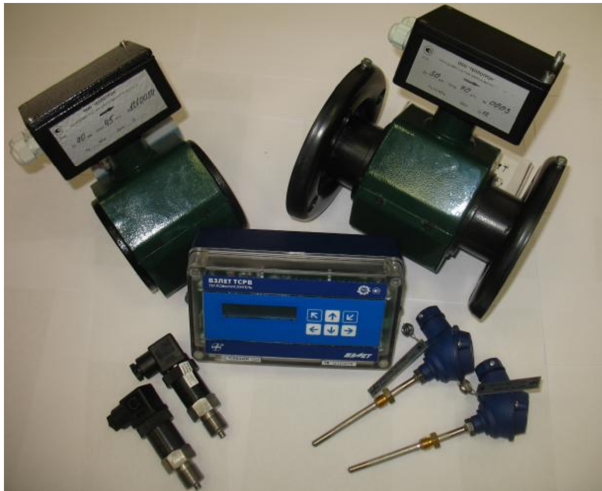
Рисунок 1 – Внешний вид теплосчетчика

Внешний вид теплосчетчика приведен на рисунке 1.