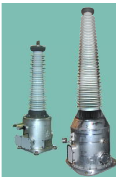
ЗНГ-УЭТМ ® -110 ЗНГ-УЭТМ ® -220

Общий вид трансформаторов напряжения антирезонансных элегазовых ЗНГ-УЭТМ ® -110 и ЗНГ-УЭТМ ® -220 представлен на рисунке 1.