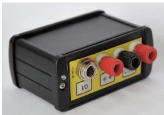
Рисунок 1 – Регистратор автономный РАД-256М

Внешний вид регистратора и обозначение места для размещения знака утверждения типа представлены на рисунках 1 и 2.