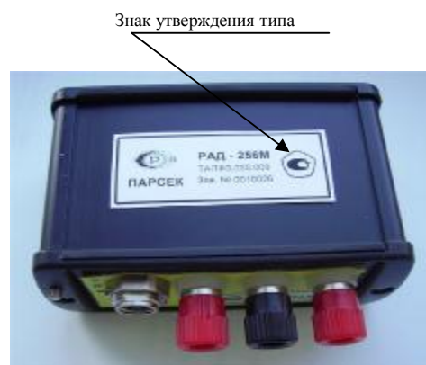
Рисунок 2 – Размещение знака утверждения типа