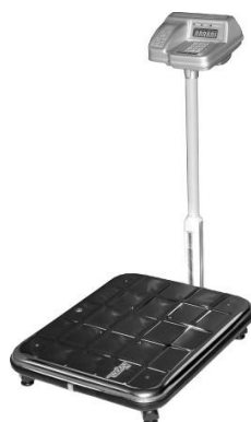
Весы напольные с терминалом управления на стойке ВЭУ-ХС-Z-(И)-СТ-Д-У