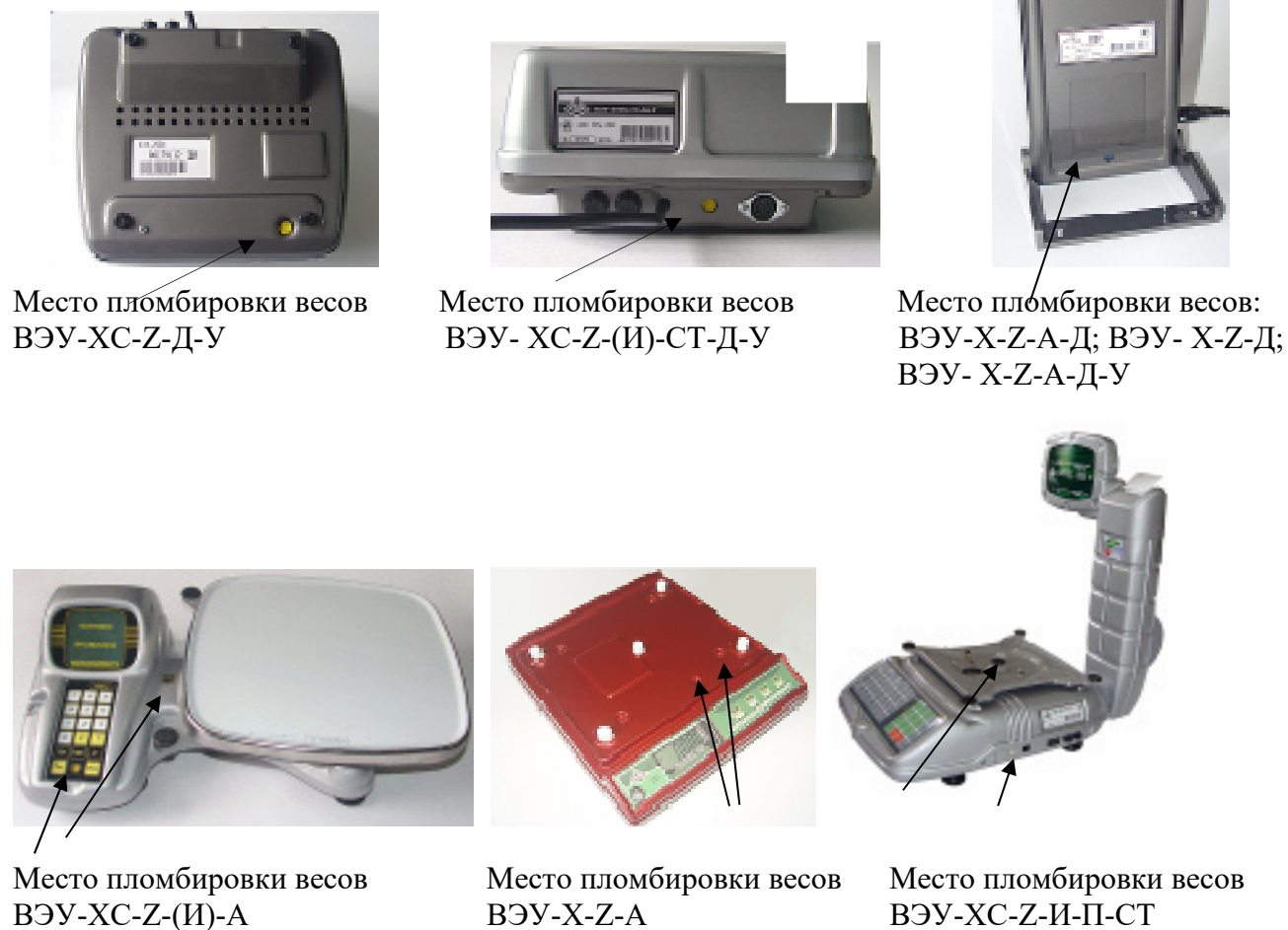
Рисунок 2 – Места расположения защитной пломбы