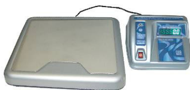
Весы напольные фасовочные ВЭУ-Х-Z-Д