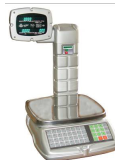
Весы с печатью этикеток ВЭУ-ХС-Z-И-П-СТ