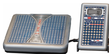
Весы напольные с автономным питанием ВЭУ-Х-Z-A-Д