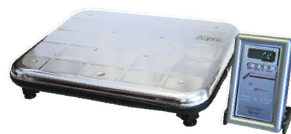
Весы напольные с увеличенной платформой ВЭУ-Х-Z-A-Д-У