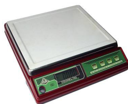
Весы фасовочные ВЭУ-Х-Z-A