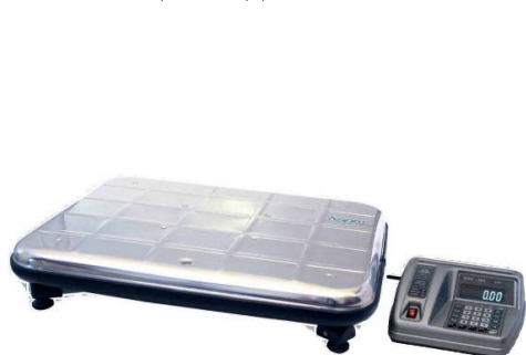
Весы напольные ВЭУ-ХС-Z-Д-У