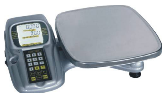
Весы торговые ВЭУ-ХС-Z-(И)-А