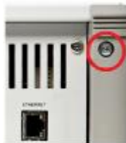
Рисунок 2 – Место на задней панели для пломбирования от несанкционированного доступа