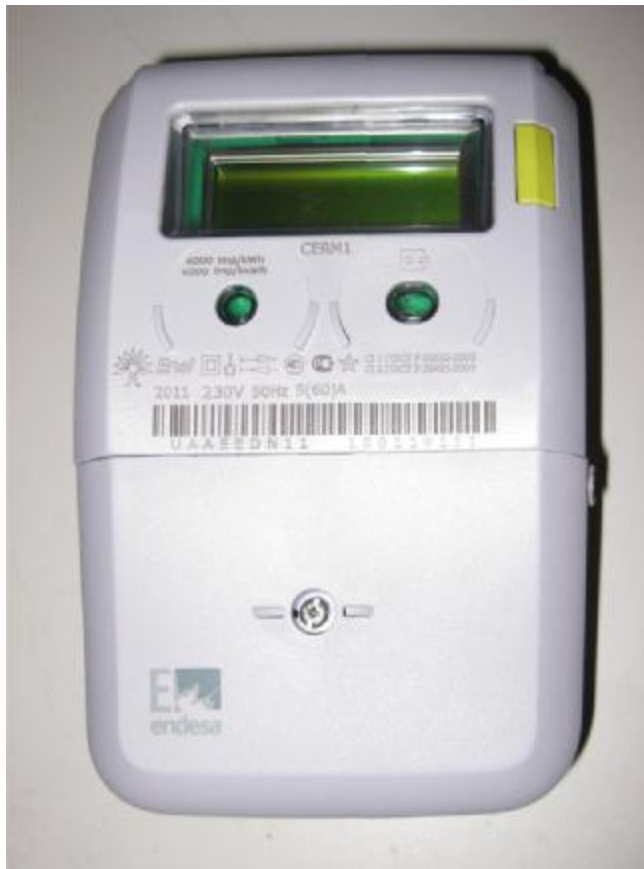
Рисунок 1 – Фотография общего вида счетчика

Для связи с компьютером используются оптические датчики ZVEI с интерфейсами USB 2.0 и RS-232. Максимальная скорость соединения с оптическим портом составляет 19200 бит/с. Все каналы связи являются защищенными и имеют ограниченный набор команд.