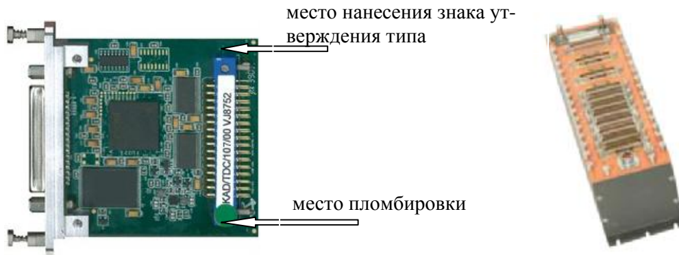
Рисунок 1 - Внешний вид модуля KAD/TDC/107 и модуля KAD/TDC/107 установленного в блок базовый KAM/CHS/13U