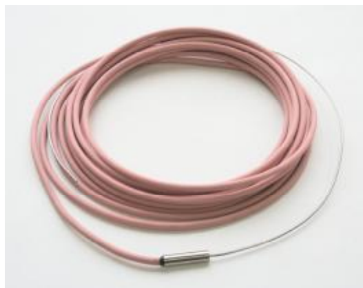
Рис. 2. Термопреобразователь серии ТС модели СТ3122/1