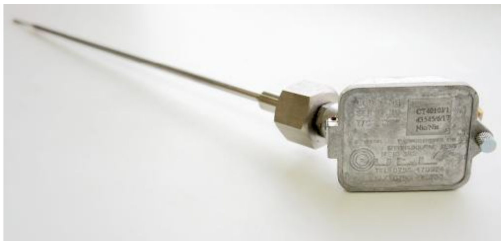
Рис. 3. Термопреобразователь серии ТС модели СТ4010J/1