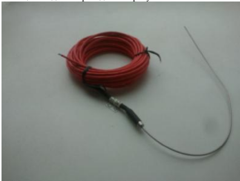
Рис. 1. Термопреобразователь серии ТС модели СТ4012H/3

Фотографии общего вида ТП приведены на рисунках 1 - 4.