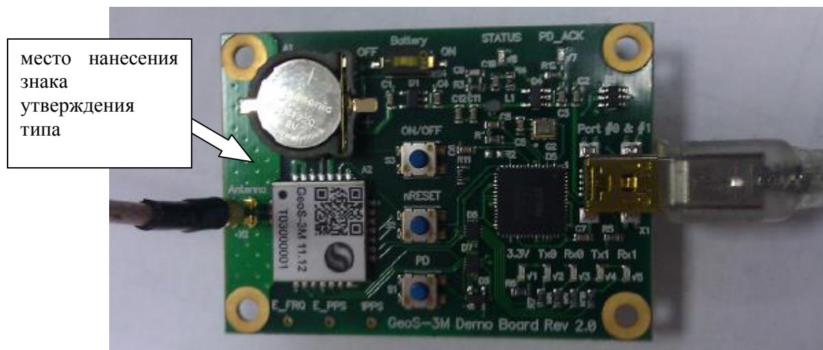
Рисунок 2 - внешний вид аппаратуры GeoС-3М