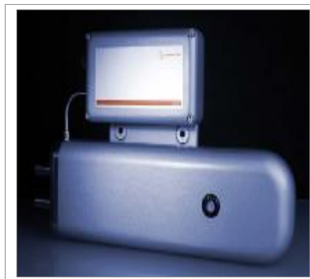
Рис.2 Внешний вид модификации DTR 4122