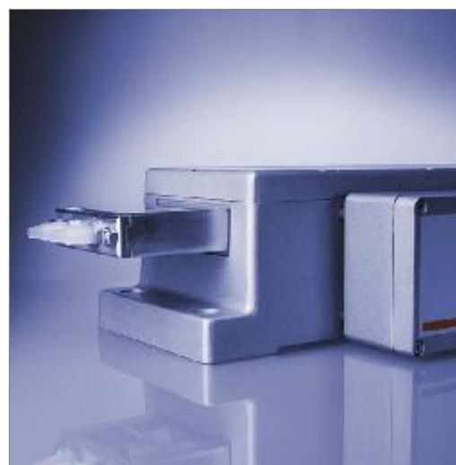
Рис.5 Внешний вид модификации DTR407