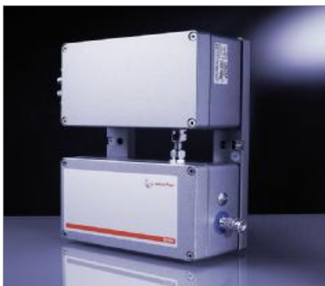
Рис.1 Внешний вид модификации DTR 422