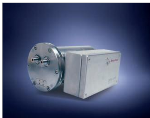
Рис.3 Внешний вид модификации DTR427S