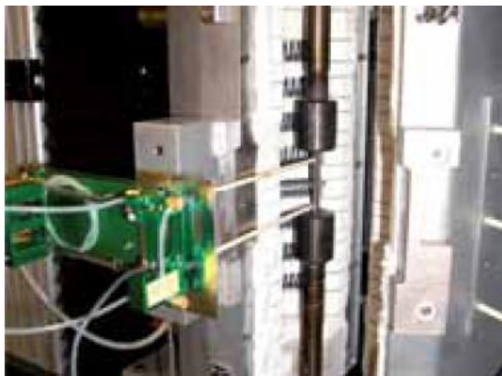
Рис. 3. Внешний вид датчиков перемещений (деформаций) 3548.