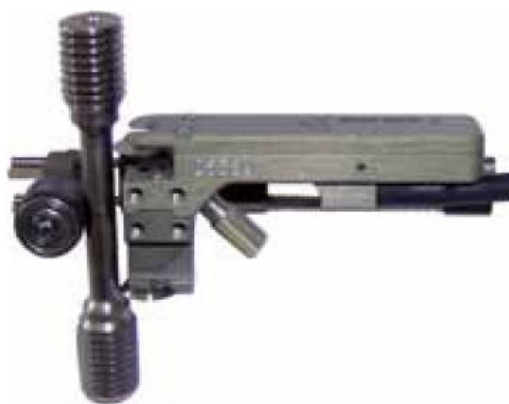
Рис. 1. Внешний вид датчиков перемещений (деформаций) Mini MFA 2.

Внешний вид датчиков перемещений (деформаций) Mini MFA 2, 3542, 3548 приведен на рисунках 1-3.