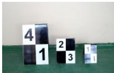
Рис. 1б. Фотография общего вида марок