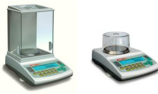
Рисунок 2 – Общий вид весов