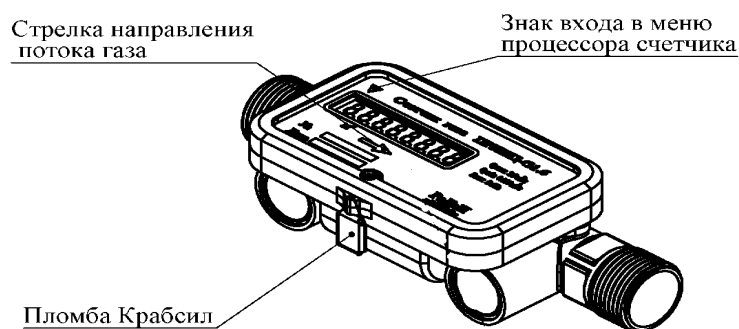
Рисунок 3 – Схема пломбировки счетчика

Для защиты от несанкционированного доступа счетчики пломбируются с помощью пломбировочной проволоки и пломбы Крабсил. Схема пломбировки счетчиков представлена на рисунке 3.