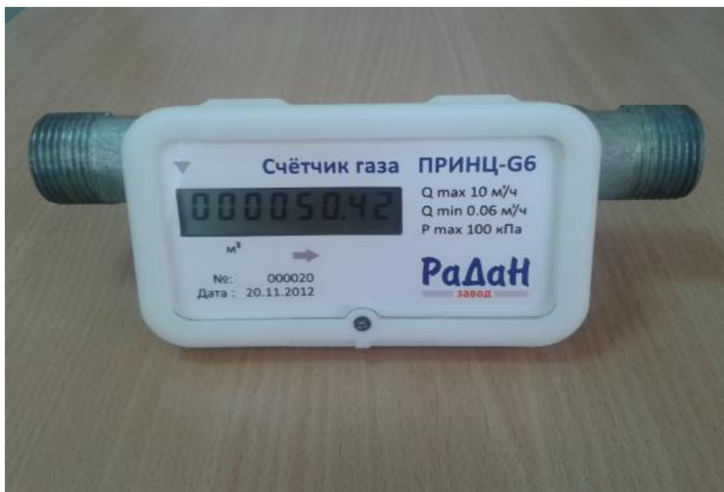
Рисунок 2 - Общий вид счетчика газа «Принц»

Для защиты от несанкционированного доступа счетчики пломбируются с помощью пломбировочной проволоки и пломбы Крабсил. Схема пломбировки счетчиков представлена на рисунке 3.