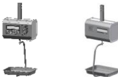
Рисунок 1 Общий вид весов электронных ШТРИХ-ПРИНТ ПВ (вид спереди и вид сзади)

Весы состоят из корпуса, грузоприемного устройства, весоизмерительного устройства, блока клавиатуры, дисплеев массы, цены и стоимости для продавца и покупателя, встроенного принтера для печати этикеток и интерфейса для стыковки с персональным компьютером (ПК) (см. Рисунок 1).