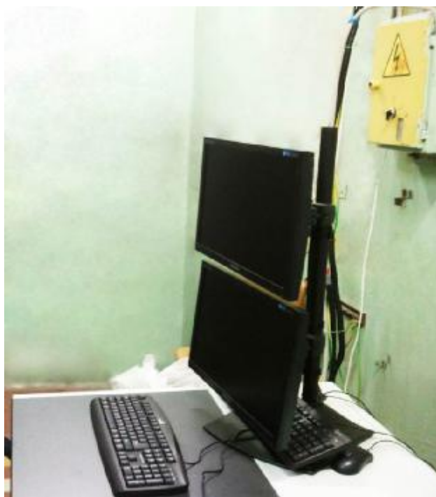
Рисунок 3 – Рабочее место оператора

Конструкция комплекса обеспечивает защиту от несанкционированного доступа к рабочим частям комплекса, воздействие на которые могло бы повлиять на результаты измерений. Защита от несанкционированного доступа в шкаф приборный и шкаф температурных преобразователей осуществляется путем закрытия на ключ и наклеиванием голографических наклеек на места возможного доступа к рабочим частям с обратной стороны шкафов. Схема размещения наклеек представлена на рисунке 4.