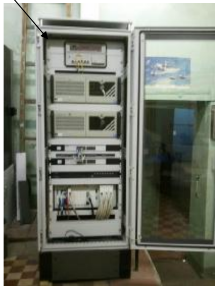
Рисунок 1 – Шкаф приборный