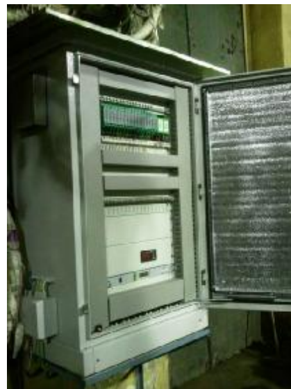
Рисунок 2 – Шкаф температурных преобразователей