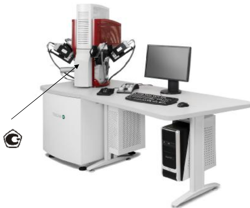
Рисунок 3 –Общий вид микроскопов сканирующих электронных TESCAN TIMA