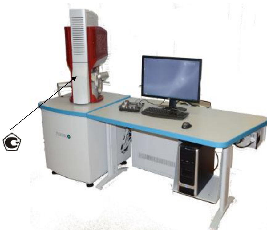
Рисунок 4 –Общий вид микроскопов сканирующих электронных TESCAN MIRA