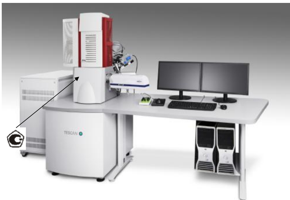
Рисунок 5 –Общий вид микроскопов сканирующих электронных TESCAN LYRA