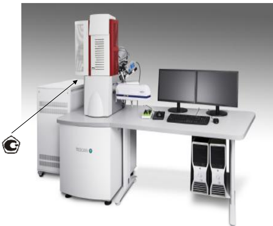
Рисунок 7 –Общий вид микроскопов сканирующих электронных TESCAN FERA