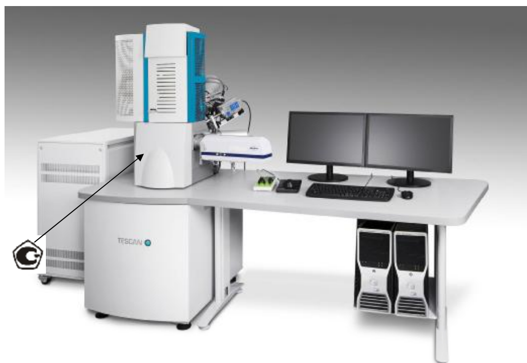
Рисунок 6 –Общий вид микроскопов сканирующих электронных TESCAN VELA