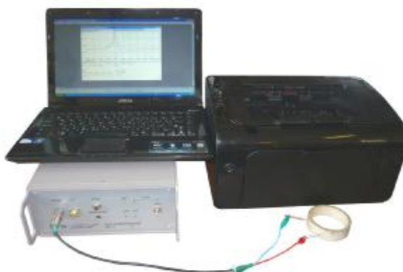
Рисунок 2 - Аппаратура «Цензурка-МА2»

Аппаратура «Цензурка-МА2»(рисунок 2) является аппаратурой настольного типа и состоит из блока измерительного, управляющей ЭВМ (персональный компьютер IBM PC Pentium IV в настольном виде или ноутбук) и печатающего устройства. Управляющая ЭВМ с операционной системой Windows имеет специальное программное обеспечение, реализующие функции управления работой аппаратуры, обработки результатов измерений, отображения измеренной и обработанной информации, ведения баз данных для контролируемых пьезоэлементов.