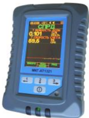
Рисунок 1 – Общий вид спектрометров

Общий вид спектрометров приведен на рисунке 1.