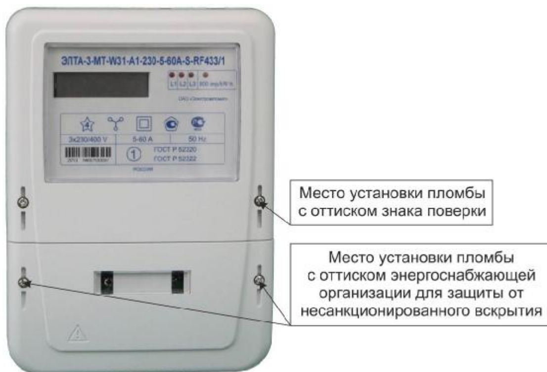
Рисунок 2 – Общий вид счетчика в корпусе модификации W31

Фотографии общего вида счетчиков, с указанием схем пломбировки от несанкционированного доступа, приведены на рисунках 2 – 4.