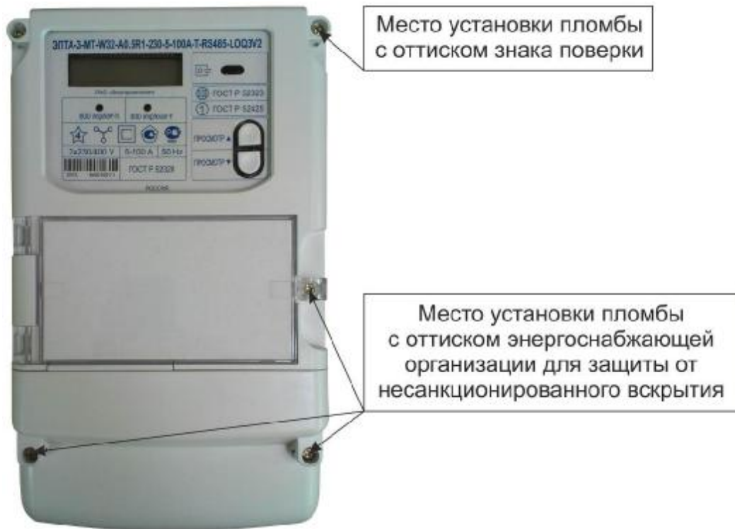
Рисунок 3 – Общий вид счетчика в корпусе модификации W32