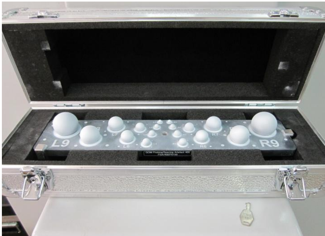
Рисунок 1 - Общий вид пространственного эталона 400

Пространственный эталон 400 представляет собой углепластиковую плиту с установленными на ней 18 стальными сферами с известными диаметрами и координатами центров сфер. Пары сфер промаркированы, например L1 и R1 (L-левая, R-правая) (Рисунок 2). Первая цифра в имени пар сфер обозначает расстояние между центрами сфер в мм, например, 16_L1-R1 означает, что расстояние между центрами сфер 16 мм. Для каждого измерительного объема системы ATOS предназначена своя пара сфер.