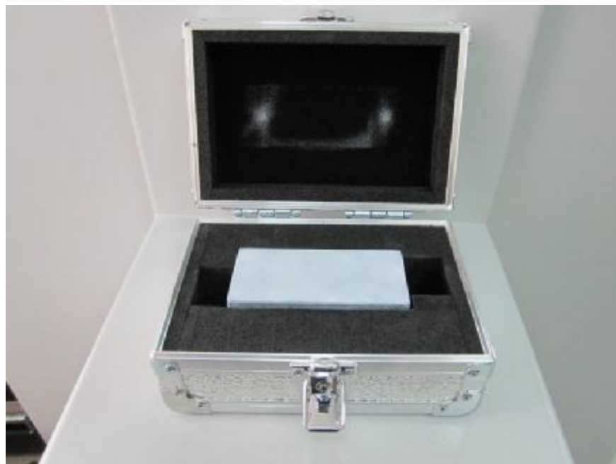
Рисунок 3- Общий вид эталонной меры отклонений от плоскостности 130