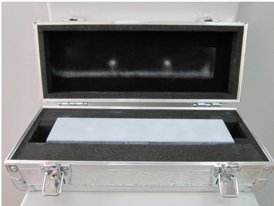
Рисунок 4- Общий вид эталонной меры отклонений от плоскостности 300

Эталонные меры отклонения от плоскостности представляет собой гранитные плиты с известными отклонениями от плоскостности в измеряемых точках. Определение отклонения от плоскостности производится путем измерений отклонений точек, расположенных на поверхности меры, предварительно выбранных в качестве реперных точек на квадратной сетке, образованной базовой системой координат X, Y.