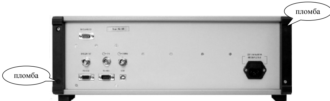
Рисунок 2 - Пломбирование аппаратного блока установки эталонной для поверки мер ослабления и магазинов затухания ЭО-01