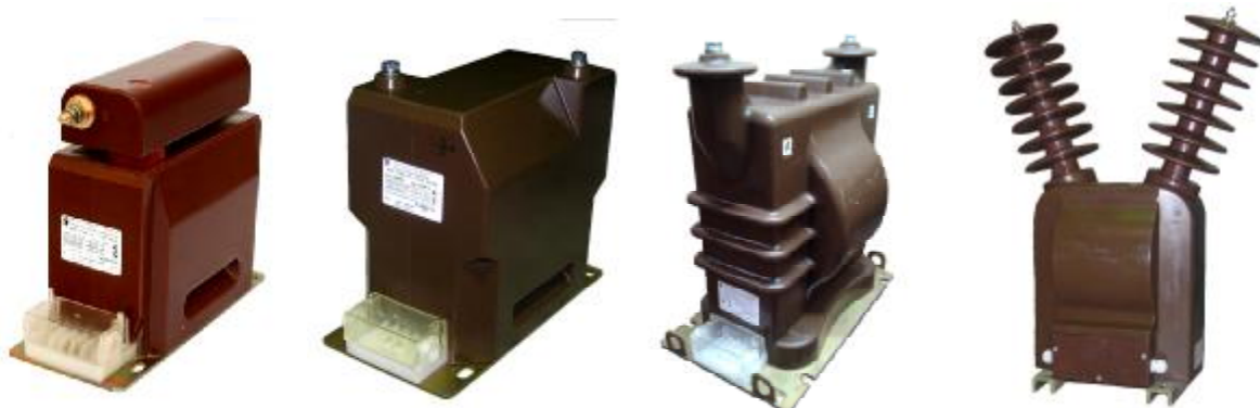
Рисунок 1 - Фотографии общего вида трансформаторов напряжения НОЛ-СЭЩ-6, НОЛ-СЭЩ-10, НОЛ-СЭЩ-20, НОЛ-СЭЩ-35, НОЛ-СЭЩ-35-IV

Принцип действия трансформаторов напряжения основан на явлении электромагнитной индукции переменного тока.