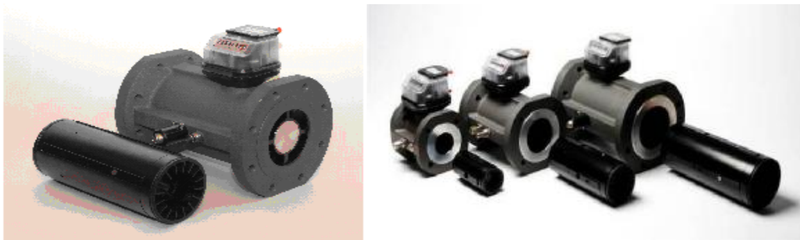
Рисунок 1 – Счетчик газа турбинный iMTM (A) со съемным измерительным блоком